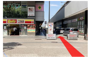
横浜アリーナ方面出口を出て デイリーヤマザキの右の道を直進