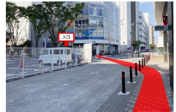
左手横断歩道向かいのビル5階です